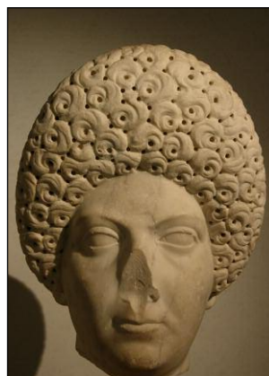
Mujer flavia, Gylptoteca Carlsberg de Copenhague